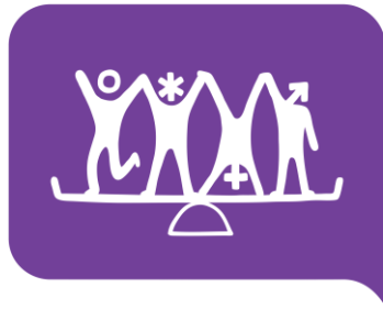
#2 Jämställdhet mellan alla kön