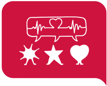
#5 Psykisk hälsa och välmående