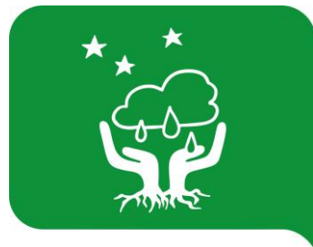
#10 Ett hållbart grönt Europa