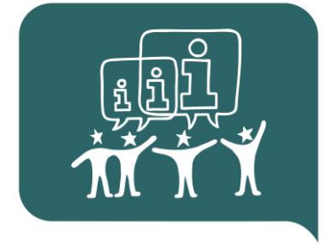
#4 Information & konstruktiv dialog