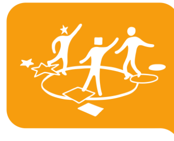
#3 Inkluderande samhällen