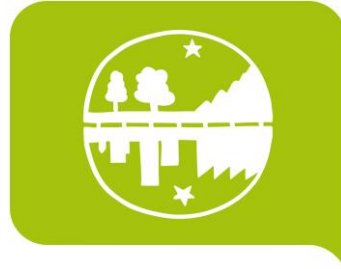
#6 Föra fram ungdomar på landsbygden