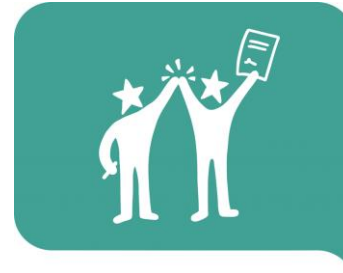
#7 Kvalitetsjobb för alla