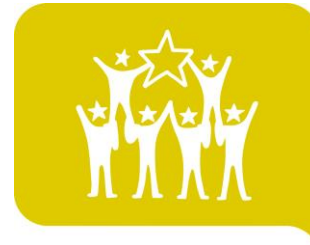
#11 Ungdomsorganisationer och Europeiska program