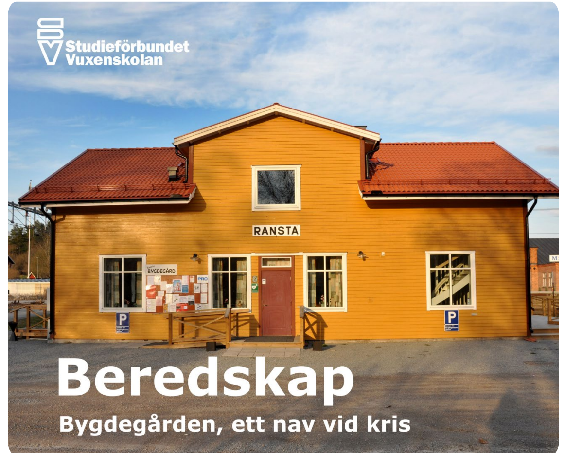
Bild från studiematerial framtaget av Bygdegårdarnas Riksförbund i samarbete med Studieförbundet Vuxenskolan